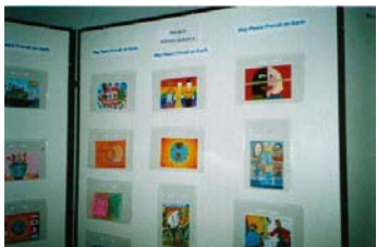
Algunas tarjetas presentadas

Aquí van algunas fotos del acto de entrega de premios del Concurso Mundial de Tarjetas por la Paz, realizado en el Jardín Japonés de Buenos Aires, el pasado 30 de octubre.