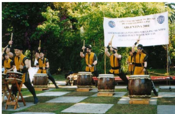
Exhibición de Mukaito Taiko