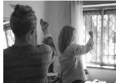
Cabrera 5654, encuentros mensuales