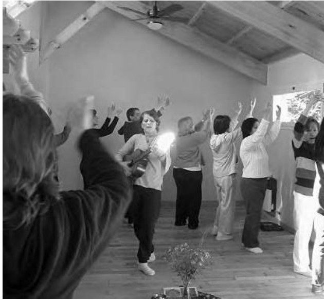
Danzas sagradas de Paz Universal En Palomar, Agosto 2005