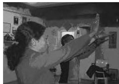
Moreno, encuentros mensuales