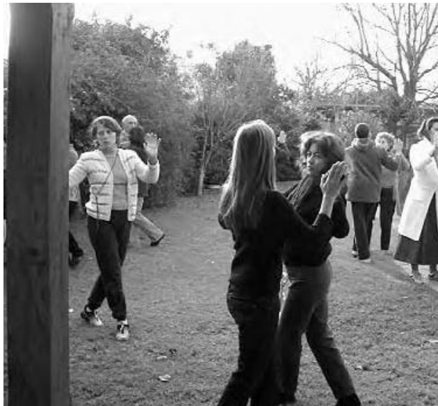
Encuentro Mensual del Proyecto, San Isidro