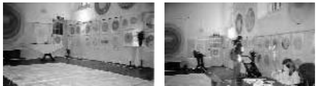
Exhibición de Mandalas en Ashburton (Inglaterra) Octubre 2005