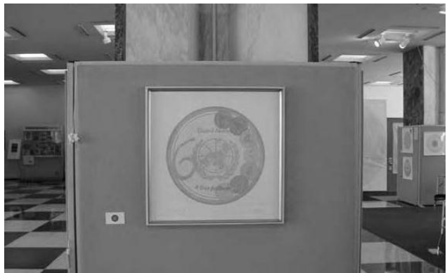
Mandala Naciones Unidas (sept 05)

Fotos para usar en contratapa y para poner en lugares vacíos (si los hubiere)