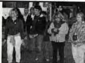
Repartimos cintas blancas ...