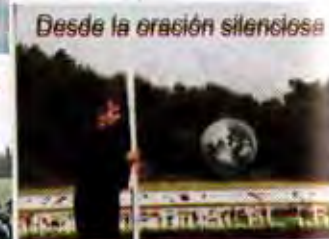
Desde la oración silenciosa

Conforme respondemos a los retos de la vida, y mientras vamos descubriendo nuestras infinitas posibilidades de modificar el medio y lo que llamamos la realidad, podemos esperar experimentar condiciones no existentes hoy, en nuestro día, en nuestros cuerpos, y ver el efecto extendido al mundo que nos rodea. TODO ES POSIBLE