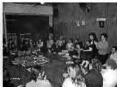
DIA GLOBAL DE MEDITACIÓN Y ORACIÓN POR LA PAZ EN CHACARITA