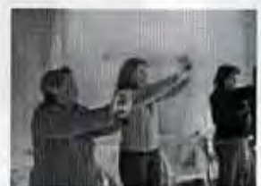
Reunión del proyecto de paz en Paso del Rey