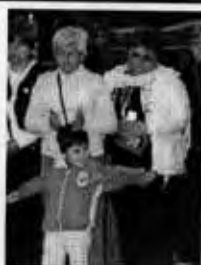
Ese día todo fue perfecto. Hasta el clima fue especial.