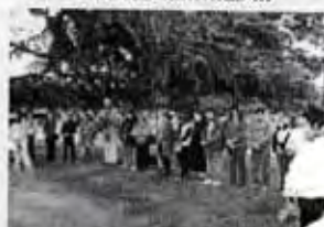
Lo que más nos emocionó fue ver muchas familias ...