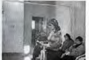
MUCHAS GRACIAS A TODOS