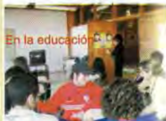
En la educación