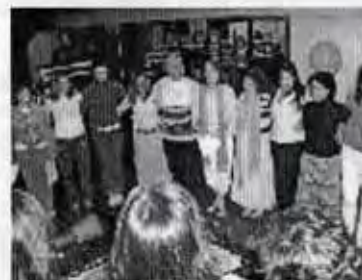
MUCHAS GRACIAS MARE, MUCHAS GRACIAS A TODOS