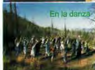
En la danza

Sólo el aire sabe tus deseos sólo el sol conduce tus pasos no dejes que la luna nuble tus pensamientos échate a andar. Deja que la materia resuelva sus problemas juega con el arco iris cada tarde de tu vida Hila los sueños en dorados hilos del amanecer vuela, vuela, vuela que sólo tus pasos ya tienen raíces vuela como la brisa perfumada del rosedal.