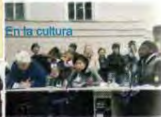
En la cultura