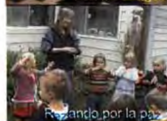
Con los amigos