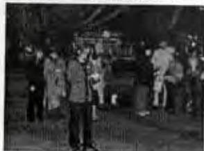
Mi asombro crecía ...