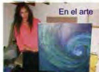
En el arte